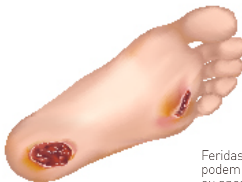
Feridas crónicas que podem demorar meses ou anos a cicatrizar

A invenção patenteada refere-se a uma formulação em gel com células estaminais do sangue do cordão umbilical para o tratamento de feridas crónicas em diabéticos, uma condição normalmente conhecida por "pé diabético".